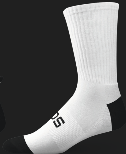
ВЫСОКИЕ РИФЛЁНЫЕ НОСКИ